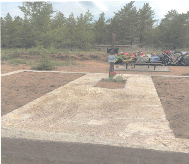
8. Схема (координаты, в том числе ГЛОНАСС (GPS) расположения захоронения центральный въезд на кладбище